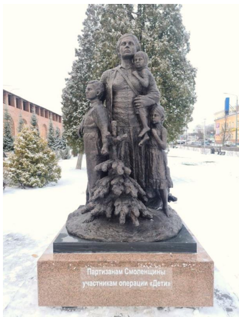
Памятник Операции "Дети" и М.И.Вольской в Смоленской области. Установлен 7 декабря 2021 года в смоленском Парке Пионеров