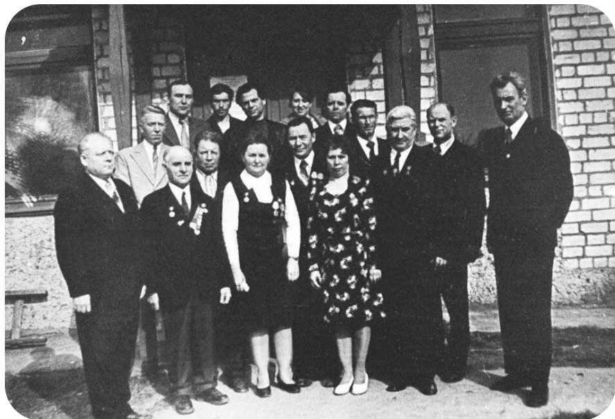
1976 год. Первая встреча бывших подростков и партизан.