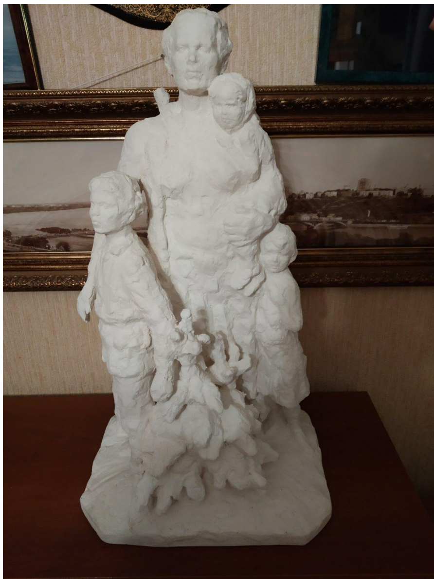
Макет памятника М.И.Вольской