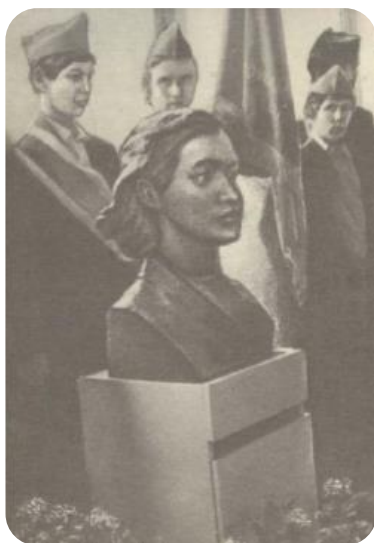
У бюста М. И. Вольской в Смольковской школе (скульптор Л.Ф. Кулакова)