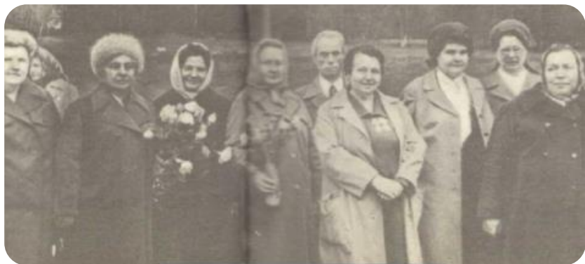
На встрече в Смольках