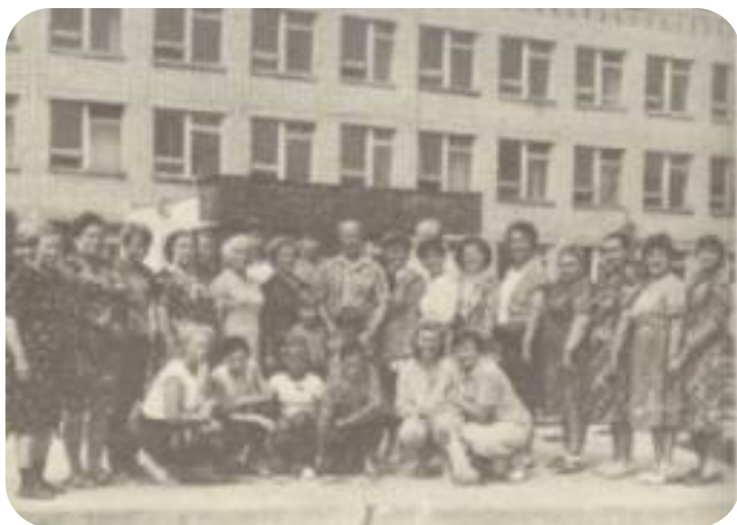
1988 год. В пос. Вербовском г. Муром встретились следопыты, партизаны и участники перехода 1942 года