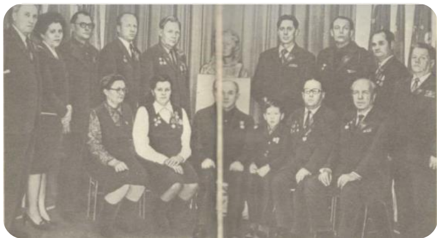
1972 год. Ногинск, школа №4. Ветераны Первой партизанской бригады у бюста Вали Богоявленской