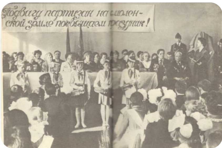
На празднике в школе № 40 г. Дзержинска