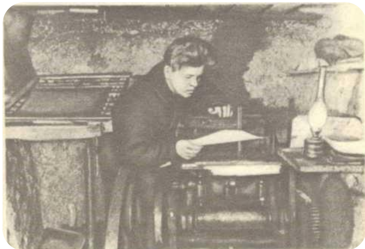
В подпольной типографии. Оставшевский район Смоленской области, 1941 год