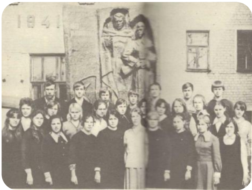
Следопыты школы № 4 г. Бор, 1977 год