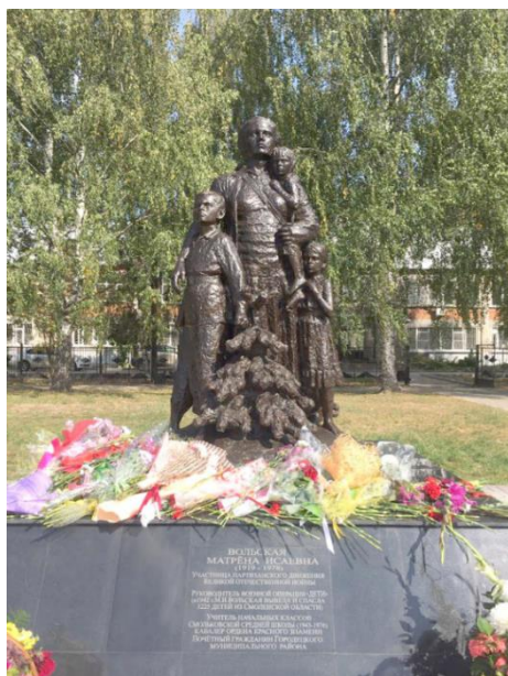
Памятник Операции "Дети" и М.И.Вольской в г.Городец, Нижегородской области. Установлен 1 сентября 2020 года на пл.Пролетарской