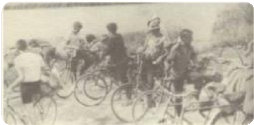
1987 год. Участники перехода по маршруту М. И. Вольской